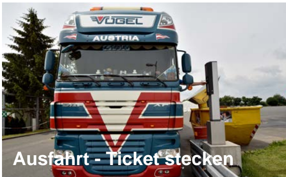
Ausfahrt - Ticket stecken

Hinweis: Unser Parkplatz ist nicht öffentlich und deshalb gibt es keine kostenlose Standzeiten für die kleine Pause oder zum Umbrücken.